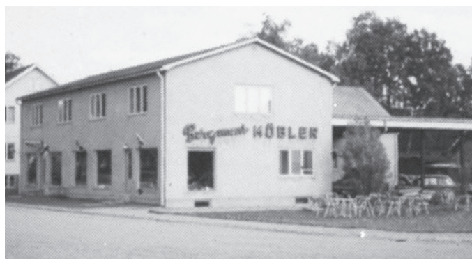
Den tillbyggda möbelaffären från 1954.