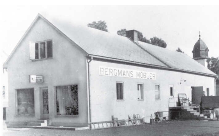
Första möbelaffären (1946) med två skyltfönster.

Den första tiden levererades möblerna med bilsläp av Åke på kvällstid. Bilar var inte så