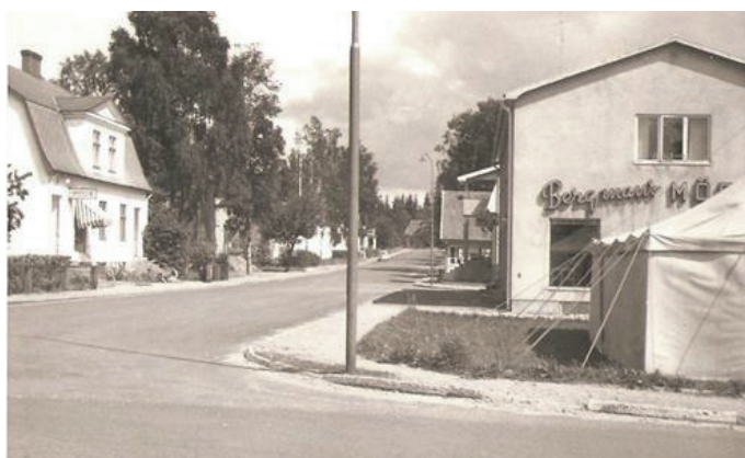
Gräsmattan framför möbelfaffären användes för att visa trädgårdsmöbler och ibland också för tältmöten.

Gungstolen har också kommit igen. En nyhet är hämtad direkt från Vita Huset och kallas "Kennedy-gungstolen".